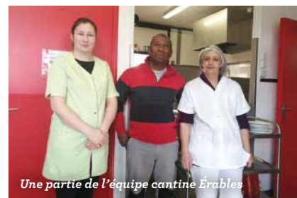
Une partie de l'équipe cantine Érables

dans laquelle on sent un véritable sens de l'entraide pour faire face à leur tâche parfois ardue. ■