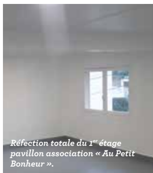
Réfection totale du 1 er étage pavillon association « Au Petit Bonheur ».