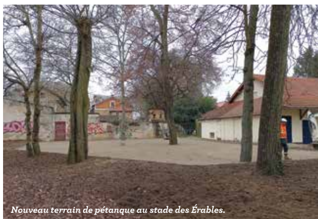
Nouveau terrain de pétanque au stade des Érables.