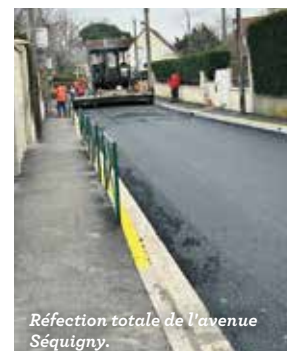
Réfection totale de l'avenue Séquigny.