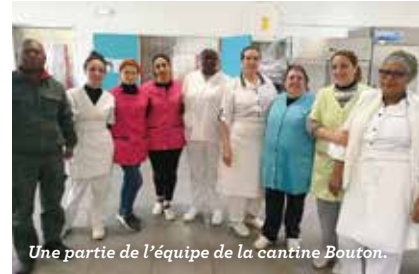
Une partie de l'équipe de la cantine Bouton.

Œuvrant toujours dans l'ombre et la discrétion, travaillant avec plaisir, créant du lien avec les enfants, ces agents se disent aussi très attachés à leur équipe,