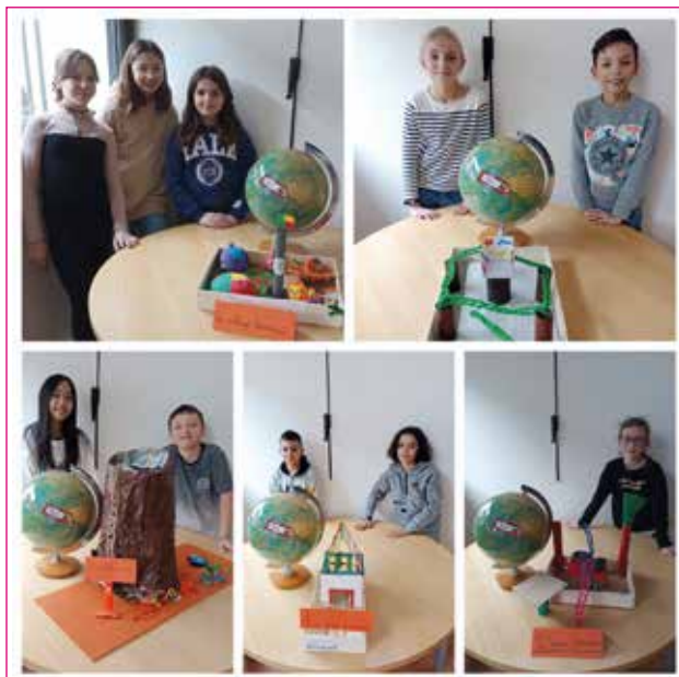
Création de maquettes habitation par des élèves du CME.

Dans le cadre de l'exposition organisée par l'association Faire Vivre une Bibliothèque à Ekpé, les 24, 25 et 26 mars sur la thématique, « Habitez, ici et ailleurs », les conseillers ont réalisé des maquettes de maisons atypiques, comme par exemple une maison dans un baobab, le village béninois, la maison béninoise, l'accro maison. Imagination et créations débordantes de l'ensemble des conseillers. ■