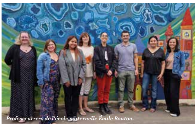
Professeur-e-s de l'école maternelle Émile Bouton.