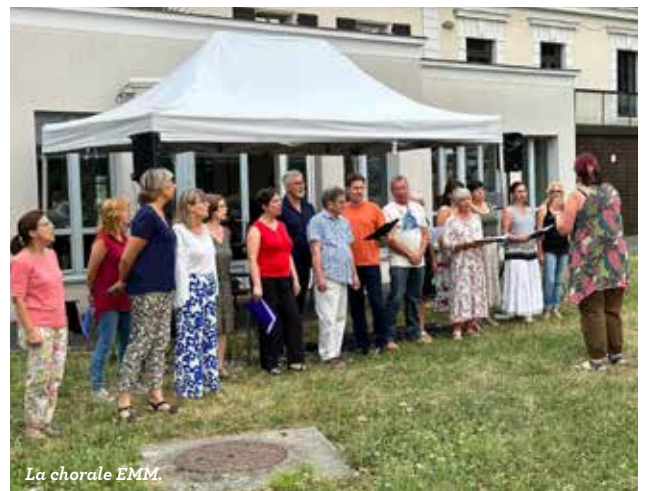
La chorale EMM.

L'EMM essaie également de faire rayonner ses valeurs musicales au-delà de ses murs : un partenariat a vu le jour en 2023, notamment avec l'Ehpad Mosaïque et bientôt les petits Villemoissonnais de la crèche et du Relais Petite Enfance pourront également bénéficier d'une sensibilisation musicale. Cette dernière fait partie intégrante du projet d'établissement de l'Ecole de Musique, puisqu'un musicien intervenant permet depuis de nombreuses années aux élèves des écoles maternelles et élémentaires Émile Bouton et Érables d'être des artistes-musiciens tout au long de l'année et lors des temps forts des spectacles créés en partenariat avec les enseignants. L'enseignement musical transmet non seulement une appétence pour la musique et les arts en général, mais permet également de développer des qualités d'écoute et de respect de la production d'autrui , et de favoriser les apprentissages (langue, mémoire et concentration). Pratiquer la musique, en milieu scolaire ou dans un établissement d'enseignement artistique, est donc un savant mélange de compétences spécifiquement musicales et de savoir-être. ■