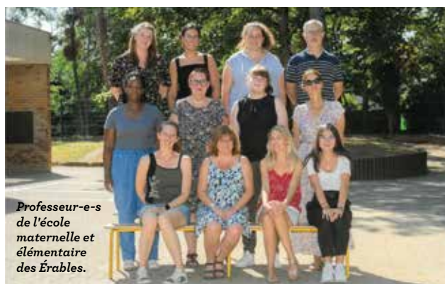
Professeur-e-s de l'école maternelle et élémentaire des Érables.