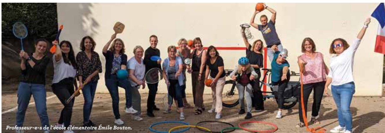
Professeur-e-s de l'école élémentaire Émile Bouton.