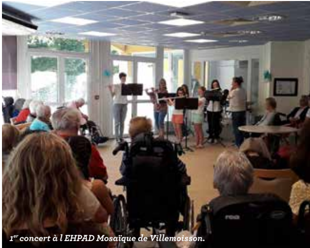
1 er concert à l'EHPAD Mosaïque de Villemoisson.