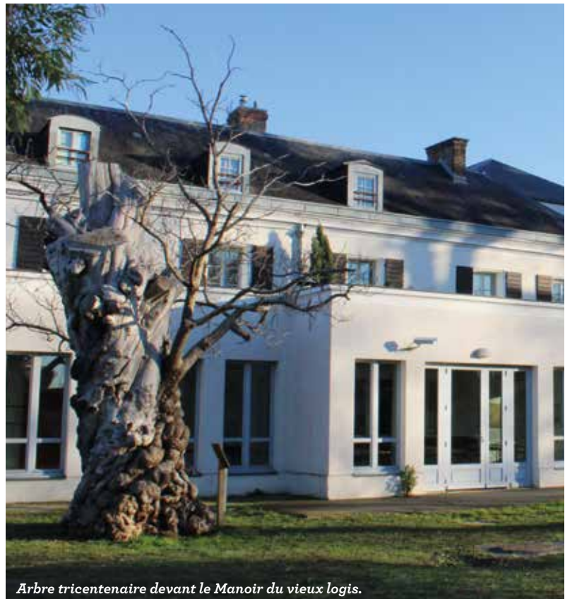
Arbre tricentenaire devant le Manoir du vieux logis.