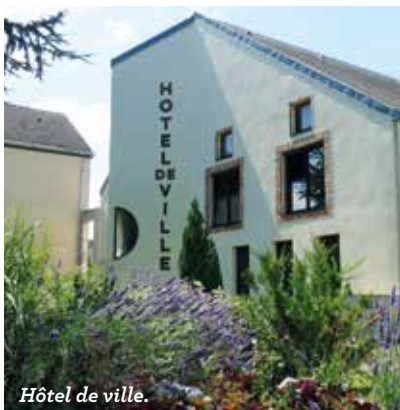
Hôtel de ville.