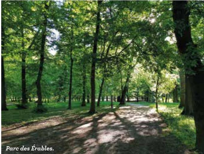
Parc des Érables.