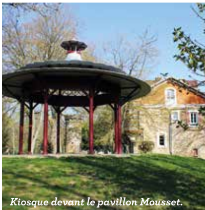
Kiosque devant le pavillon Mousset.