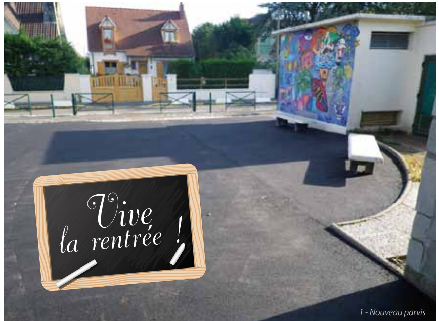
1 - Nouveau parvis

« Et puis quoi d'autre de neuf à Bouton ? ». Le bureau de la directrice, mais ça on ne le voit pas, sauf quand on est convoqué... Le vestiaire des dames de services (là non plus pas d'accès au public), toute la peinture de la cuisine (2) qui a été refaite pendant l'été... Et puis bien sûr la cour de récréation qui a été « remise à neuf », les classes qui sont toutes propres.