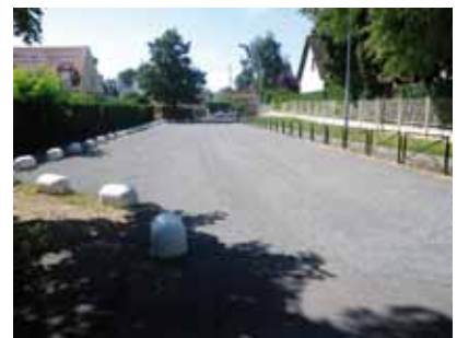
4 - Réfection du parking