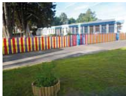
3 - Mise en couleur de la barrière