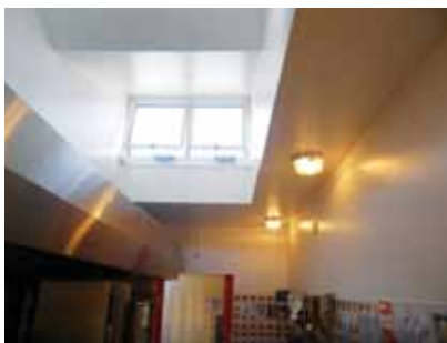
2 - Rafraîchissement de la cantine